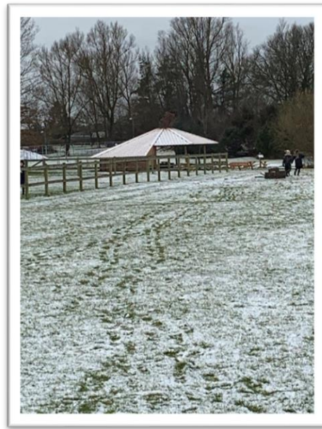
Afd. Balsmoseskolens bålhytte bag Klub Sødalen

Egedal Kommunes politikere har bevilget økonomi til opstilling af madpakkehuse på alle kommunens skoleafdelinger.