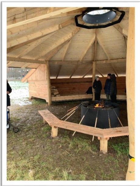
Afd. Balsmoseskolens bålhytte