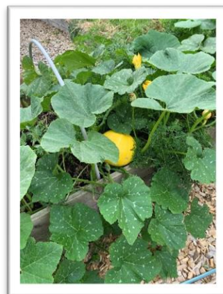
Afgrøder i skolehaven