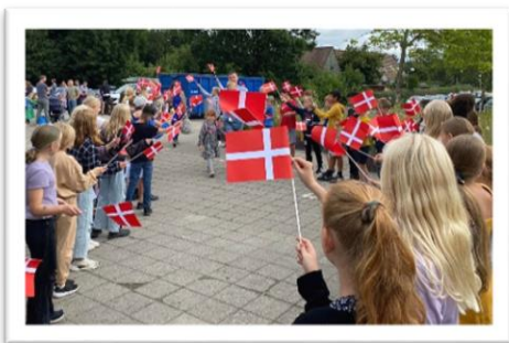
Første skoledag på Balsmoseskolen

Vi starter ligeledes et skoleår, hvor vi fortsætter arbejdet med de indsatsområder I allerede kender.