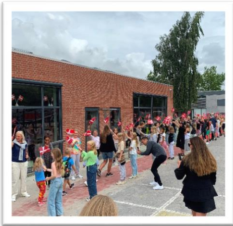
Første skoledag på Boesagerskolen

Vi har sagt festligt velkommen til vores mindste nye elever, som er "flaget" ind på skolen af storevenner.