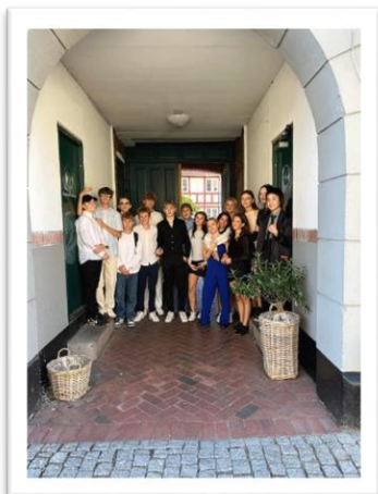
Filmpris til 9.y på Boesagerskolen