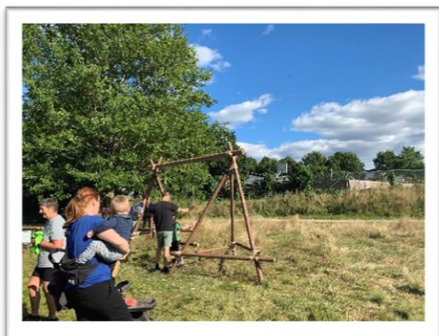
Ude liv – åbent hus i Balskøbing ugen.

Til slut et par stemningsbilleder fra skolens liv: