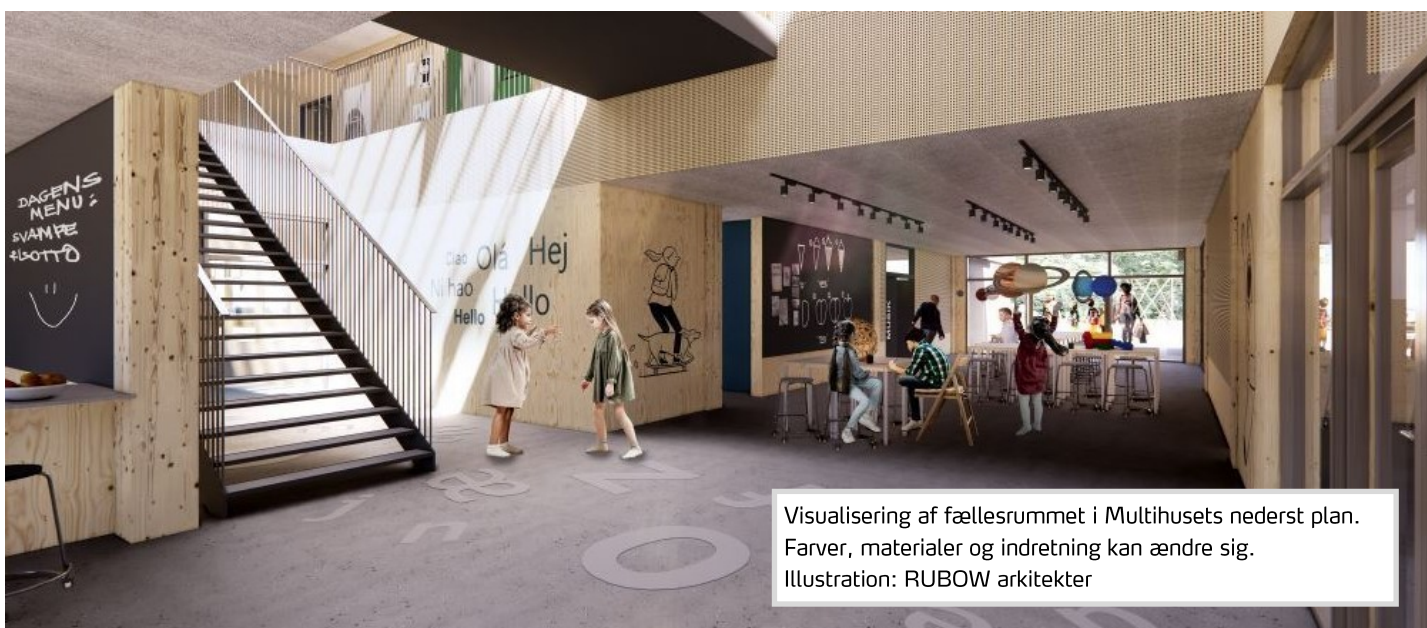
Visualisering af fællesrummet i Multihusets nederst plan. Farver, materialer og indretning kan ændre sig. Illustration: RUBOW arkitekter

Når byggeriet er helt færdigt i 2028, er Balsmoseskolen udbygget til tre almene spor og et spor i kompetencecentret.