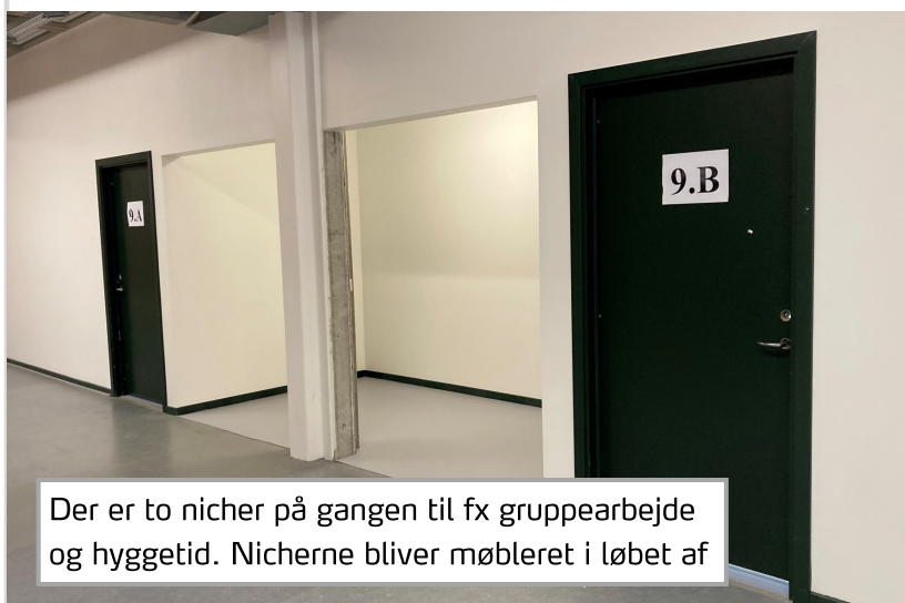
Der er to nicher på gangen til fx gruppearbejde og hyggetid. Nicherne bliver møbleret i løbet af

Når anden etape af byggeriet er helt færdigt, er Balsmoseskolen udbygget til tre almene spor og et spor i kompetencecentret.