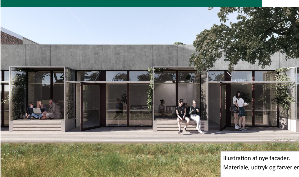
Illustration af nye facader. Materiale, udtryk og farver er ikke endelige.

Det betyder dog, at vores p-plads syd for skolen afspærres i en periode efter påske. I stedet må parkering foregå ved kulturhuset eller bag centeret.