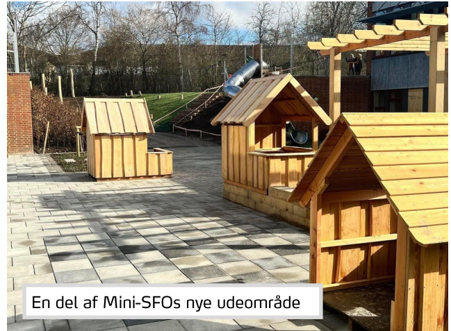
En del af Mini-SFOs nye udeområde

Fra slut uge 19 etableres der en ny midlertidig udkørsel på vores p-plads syd for skolen mod Flodvej, da der skal graves ved den nuværende udkørsel. Vær opmærksom på, at det også er muligt at parkere ved kulturhuset eller bag centeret. Det vil være en hjælp, hvis I udnytter dette.