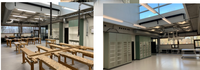
Håndværk og design har fået direkte adgang til flere rum.