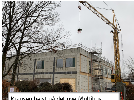
Kransen hejst på det nye Multihus.